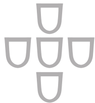
Konferencia vyšších rehoľných predstavených na Slovensku